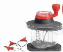
Nomination Product: Betty-Bossi-Küchen blitz by Alfredo Häberli Design.