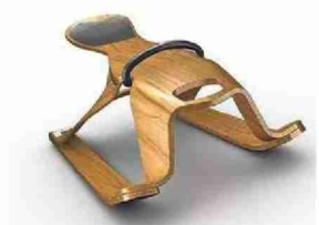
Nomination Product: Schlitten Firun von Götte & Partner Industrialdesign.