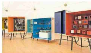
Nomination Interior: Die Wanderausstellung «Heimliche Helden».