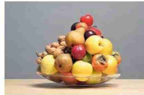
Nomination Product: Schale Flat O von Nikolas Kerl.